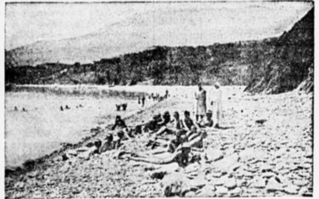
На пляже под солнцем.