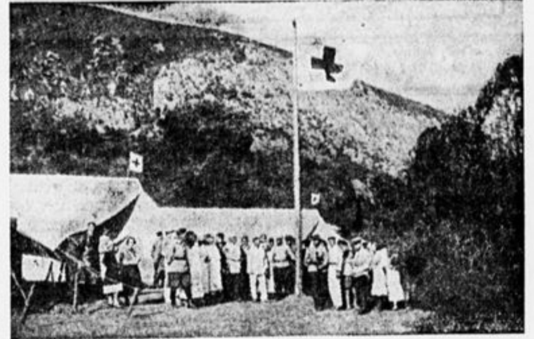
У мачты Артека.

Палатки для ребят большие, удобные, американского типа, с окнами. В два ряда вдоль палатки установлены походные кровати. У изголовья столик на 2 человека с 2-мя ящиками, а на