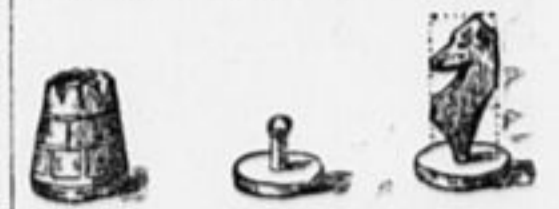
4. Тура. 5. Пешка. 6. Конь.

Деткор Шпунт, из города Брянска, предлагает тот же способ изготовления самодельных шахмат,